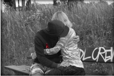
Nr. 9 Troost