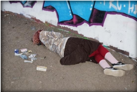
Nr. 10 Ohne Worte