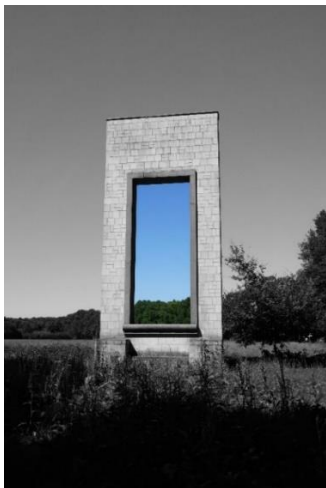
Nr. 20 Fenster zum Himmel